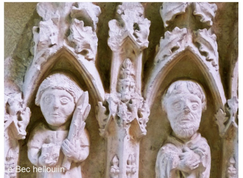
le Bec hellouin