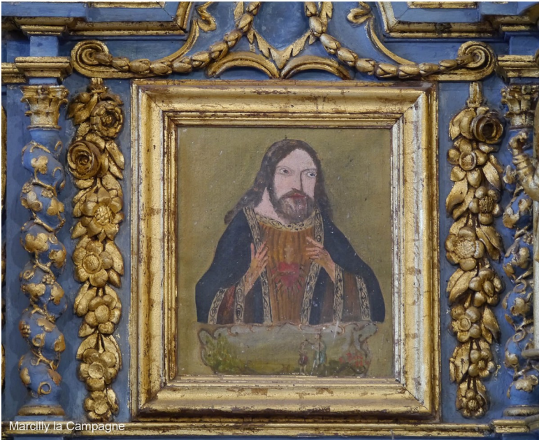
Marcilly la Campagne