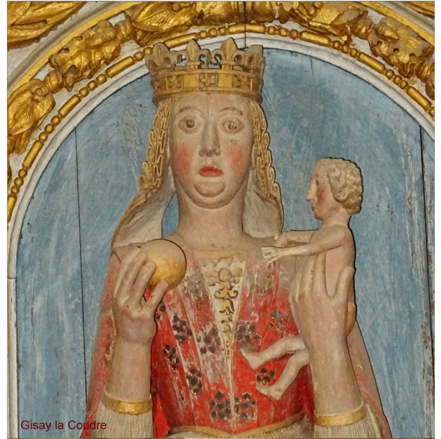
Gisay la Coudre