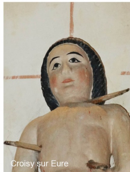
Croisy sur Eure