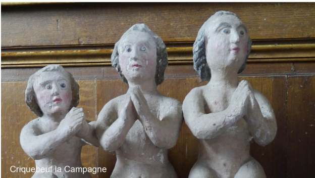
Criquebeuf la Campagne